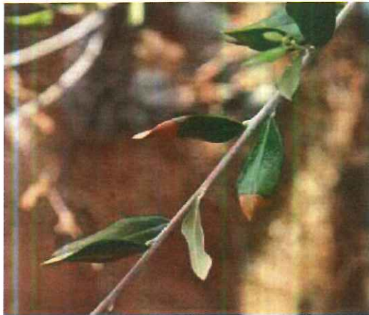
Brunissement foliaire à Xylella fastidiosa sur Olea europaea

http://agriculture.gouv.fr/sites/minagri/files/xylella_fastidiosa_symptomes_et_risques_de_confusions_biotiques_et_abiotiques_dgal-1.pdf