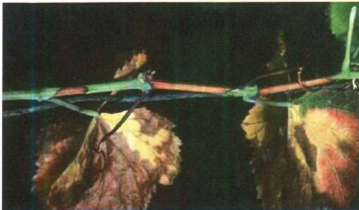
Xylella fastidiosa sur Vitis vinifera

Le non-aoûtement au niveau des nœuds est un symptôme spécifique qui doit fortement alerter.