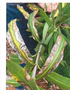
Nerium oleander (Laurier rose)

En cas de suspicion, contacter immédiatement le SRAL Bretagne pour une inspection officielle. Assurez vous au préalable que la plante a été correctement arrosée (sans excès) et qu'elle fait partie des végétaux sensibles à Xylella fastidiosa .