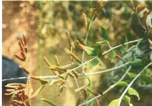
et finalement Dépérissement