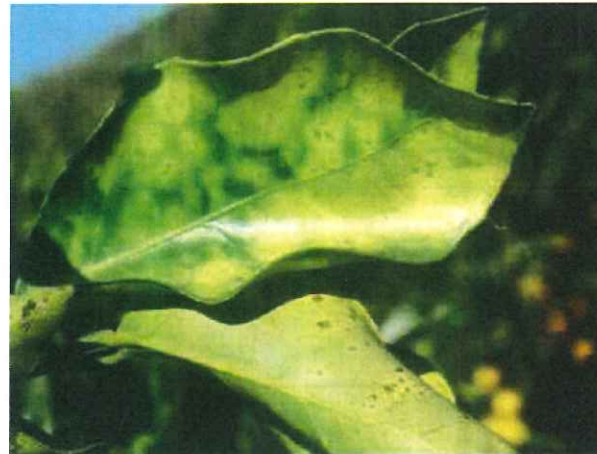
taches chlorotiques typiques de Xylella fastidiosa sur Citrus sinensis

Le non-aoûtement au niveau des nœuds est un symptôme spécifique qui doit fortement alerter.