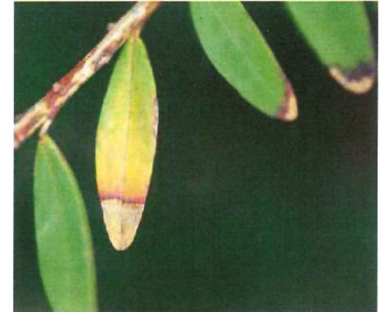
Brunissement à Xylella fastidiosa sur Polygala myrtifolia