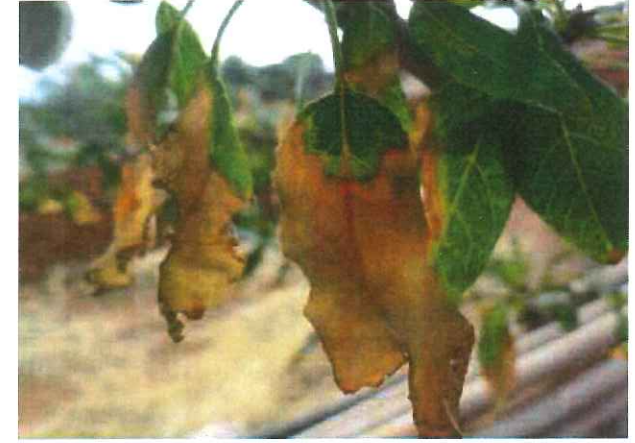
Brunissement foliaire à Xylella fastidiosa sur Prunus amygdalus