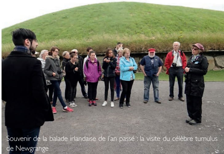
Souvenir de la balade irlandaise de l'an passé : la visite du célèbre tumulus de Newgrange

Le jumelage entre Saint-Thurien et Kilmacow, en Irlande, se passe on ne peut mieux. Après la balade des Bretons dans le comté de Kilkenny l'an passé, les Irlandais seront accueillis en Bretagne fin juillet pour un séjour d'une semaine. Un programme copieux les attend.