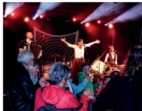
En juillet, le festival Ethno Folk/

Mardi 1 er : Marche du 1 er mai Hentou Coz Mardi 8 : Cérémonie commémorative UNC-AFN Mercredi 16 : Goûter dansant de l'Amicale du 3 ème Âge Samedi 19 : Fest Leur Samedi 26 : Assemblée générale de l'USST et repas Dimanche 27 : Fête des mères