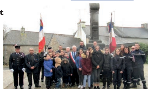
Le 11 novembre 2018 sera une date particulière

Dimanche 7 : Repas des personnes âgées (CCAS) Mercredi 17 : Goûter dansant de l'Amicale du 3 ème Âge