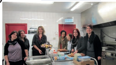
En mars, le repas de l'Amicale Laïque

Samedi 3 : Soirée organisée par l'US St Thurien Mercredi 21 : Goûter dansant de l'Amicale du 3 ème Âge Samedi 24 : Soirée de l'Amicale Laïque Dimanche 25 : Après-midi théâtre, Comité de Jumelage Samedi 31 : Fest-noz de pAs paR haZ'art et Kanerien Sant Turian