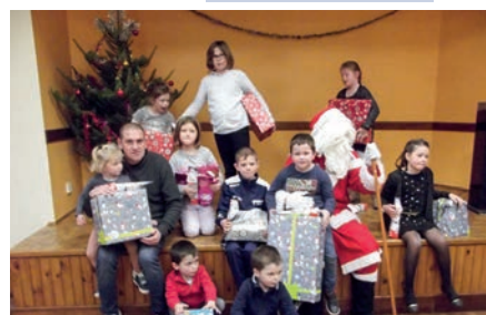
En décembre, l'arbre de Noël des pompiers

Lundi 3 : Préparation du calendrier des animations Samedi 8 : Téléthon inter-associations Samedi 8 : Repas de fin d'année de l'Amicale du 3 ème Âge Samedi 15 : Sainte-Barbe des sapeurs-pompiers Dimanche 16 : Arbre de Noël des sapeurs-pompiers Vendredi 21 : Goûter de Noël de l'école, Amicale Laïque