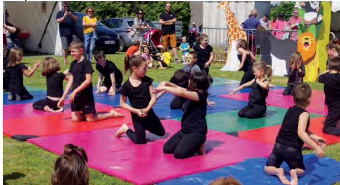
Les enfants en spectacle lors de la kermesse de l'école