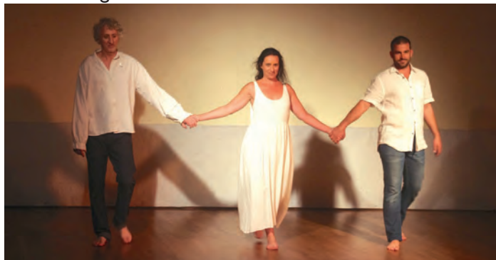
Théâtre autour des violences conjugales, début août, à l'initiative du comité des fêtes