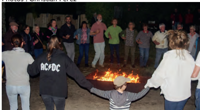
Toujours du monde et une belle ambiance au fest Leur