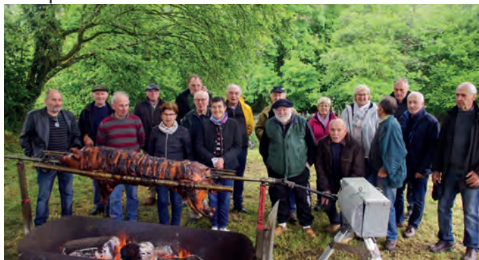
Le cochon grillé de la section locale de l'UNC