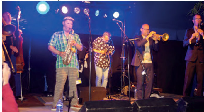
Musiques du monde à l'Ethno Folk Festival