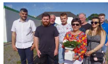
À gauche, le nouveau bureau de l'association Digor'n Nor, à droite, celui de l'USST