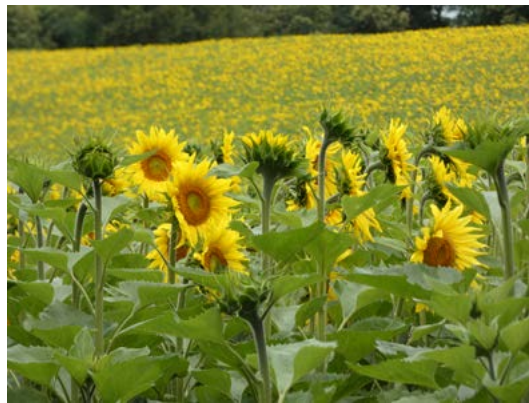
St Thurien affiche ses couleurs d'été